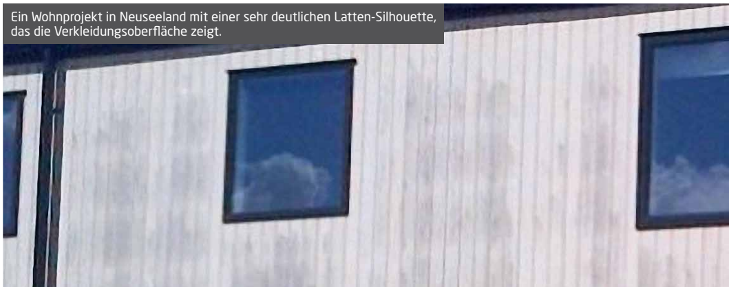
Ein Wohnprojekt in Neuseeland mit einer sehr deutlichen Latten-Silhouette, das die Verkleidungsfläche zeigt.

Weitere Informationen zur Bodenreinigung erhalten Sie bei Ihrem zuständigen Vertriebsmitarbeiter.