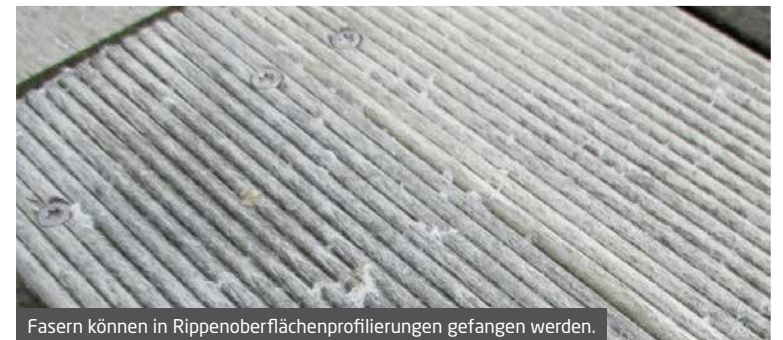
Fasern können in Rippenoberflächenprofilierungen gefangen werden.

In all diesen Fällen ist die Haltbarkeit des Accoya® Holzes in keiner Weise beeinträchtigt. Jedoch empfiehlt es sich, regelmäßig alle losen Fasern zu entfernen, da diese sich an einem Ort sammeln, wo sich dann Organismen niederlassen, was zur Verunstaltung des Holzes führen kann.